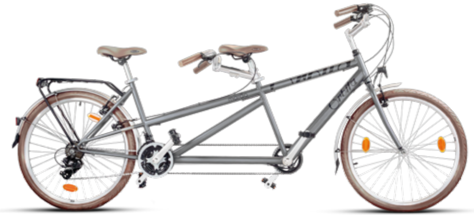
Marão _ Tandem (Bicicleta convencional)