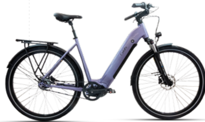
Mondego _ E-Urban Mulher (Motor Central)