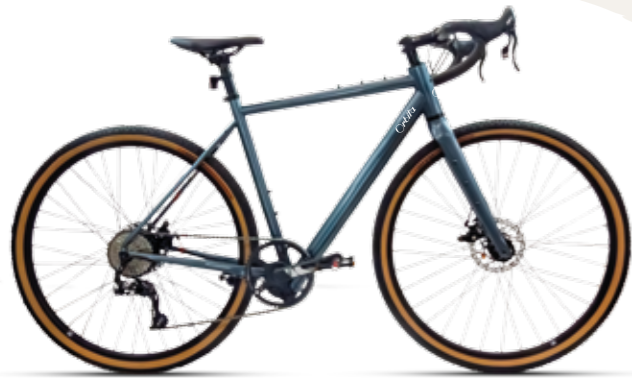
Lima _ E-Gravel (Motor Roda de trás)