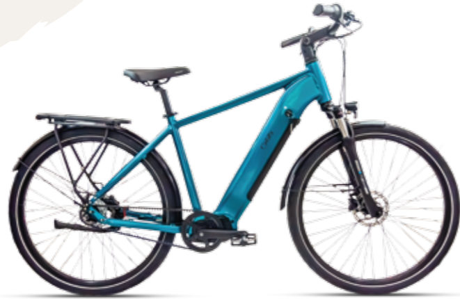
Mondego _ E-Urban Homem (Motor Central)